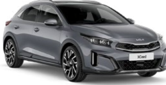
Aytaşı Gri (CSS)