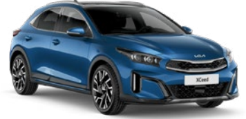
Gökyüzü Mavi (B3L)