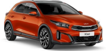
Füzyon Turuncu (RNG)