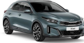
Yuka Gri (USG)