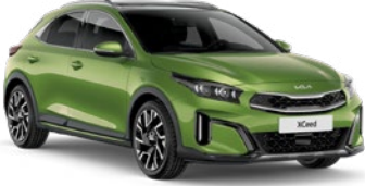
Seladon Yeşil (CE6)