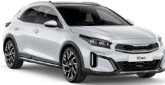
İnci Beyaz (HW2)