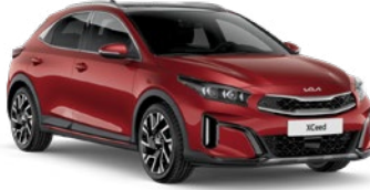
Manyetik Kırmızı (AA9)