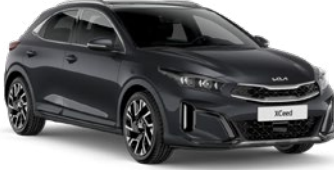
Fırtına Gri (H8G)